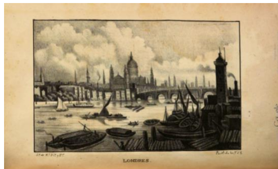
Fig. 2. “Londres” de Diario de los niños , tomo I, 1939, hoja suelta entre páginas 104 y 105.

Este argumento se manifiesta ejemplarmente en un artículo titulado “Londres. Influencia de la civilización” (I, 103-17). Aquí, antes de presentar en detalle todas las riquezas de la ciudad inglesa, se dedican dos columnas a describir la pobreza del continente europeo en términos geográficos para concluir que “es tal el poder del espíritu humano, que esta region indigente, áspera y salvaje, que la naturaleza solo habia adornado de bosques, solo habia enriquecido de hierro, se ha transformado completamente por una civilizacion de cerca de 4000 años” (I, 103-04). El artículo utiliza el detalle para describir los paisajes londinenses desde la fundación de la ciudad antes de la era cristiana hasta el momento de exuberante riqueza que definía la ciudad en ese momento. Para más impacto se incluye una litografía (Fig. 2).