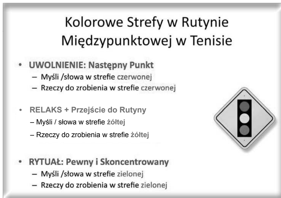
Ryc. 2. Kolorowe Strefy w Rutynie Międzypunktowej w Tenisie

poświęca mniej czasu na wykorzystanie technik mentalnych niż golfista pomiędzy uderzeniami prowadzącymi go do dołka). W czasie warsztatów (sesji treningu mentalnego) zawodnicy korzystają z kolorowych długopisów, by po szczegółowym omówieniu każdej ze stref z osobna oraz wszystkich trzech we wzajemnym powiązaniu, podsumować na własny użytek instrukcje behawioralne („rzeczy do zrobienia/unikania w danej strefie”) oraz poznawcze („myśli/słowa w danej strefie”).