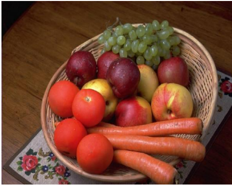
Tabla 1: Estadísticas de la Muestra de la Encuesta